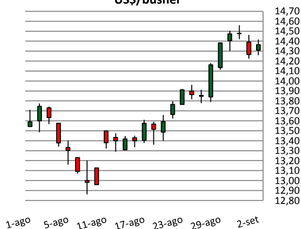
Contrato de soja na Bolsa de Chicago US$/bushel

MERCADO FUTURO: Os contratos futuros de soja negociados na Bolsa Mercantil de Chicago (CBOT/CME Group) alcançaram preços acima dos US$ 14,55 esta semana, valores antes vistos em julho de 2008. As incertezas sobre a produtividade e as previsões climáticas adversas cooperaram para isso. A quinta-feira registrou um recuo dos preços devido à realização de lucro por parte de investidores. Já no último pregão os preços se recuperaram por conta de mais uma redução das estimativas de produção, desta vez pela INTL FCStone. Na sexta-feira o contrato com vencimento em novembro encerrou a US$ 14,44/bushel. O contrato de março encerrou a US$ 14,59/bushel. O dólar encerrou cotado a R$ 1,63.