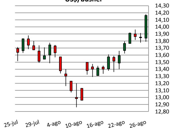
Contrato de soja na Bolsa de Chicago US$/bushel

MERCADO FUTURO: Os contratos futuros de soja negociados na Bolsa Mercantil de Chicago (CBOT/CME Group) iniciaram a semana com leves altas por notícias climáticas e também por conta da redução em 2 pontos percentuais na quantia de lavouras em condições boas e excelentes. Na quarta e quinta-feira, sem notícias de grande influência sobre a commodity , o mercado operou estável, com leves baixas. Na sexta-feira a Pro Farmer divulgou um relatório que aumentou a produtividade dos EUA para 46,8 sacas/ha, ante a divulgação do USDA no início do mês de 46,4 sacas/ha. Porém a falta de chuva vem causando “estresse” nas plantações e dando sustentação aos preços. O vencimento setembro encerrou a sexta-feira cotado a US$ 14,16/bushel. O contrato março/12 encerrou cotado a US$ 14,34/bushel.