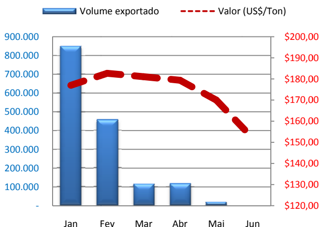
Volume e valor médio recebido de milho Mato Grosso. (US$/Ton)

VOLUME E VALOR MÉDIO RECEBIDO DE MILHO MATO GROSSO: O valor recebido pela tonelada exportada em Mato Grosso em 2010 tem seguido a tradicional lei de Oferta e Demanda, na qual o aumento da oferta do grão com o início da colheita derrubou os rendimentos em 14%. Os valores recebidos pelos exportadores saíram de US$ 177,00 em janeiro para US$ 151,96 em junho, valor 10% maior que no ano anterior, quando o preço da tonelada de milho em junho era de US$ 138,05. Desde que a colheita começou no final de maio o valor recebido pela tonelada do cereal caiu 10%. As exportações em junho somaram 618 toneladas, volume menor em relação aos outros meses pois concentra principalmente os últimos embarques do milho da antiga safra. Para efeito de comparação, em 2010 o volume acumulado das exportações é 6% inferior ao mesmo período do ano anterior.