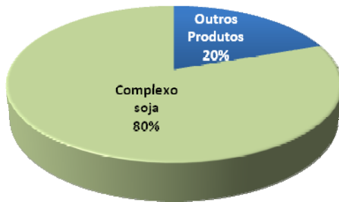
Exportações soja Mato Grosso de Jan/09 a Ago/09 (US$/t)