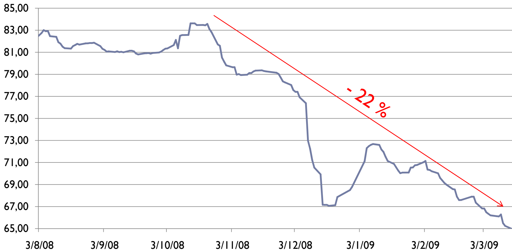
Variação diária do preço da arroba do boi gordo (R$/@)